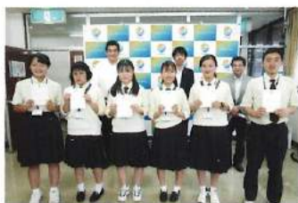
高校生まちづくり課プロジェクト