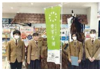
えひめ南予さずな博(伊予灘ものがたり) ボランティアガイド