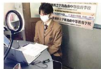
Glocal High School Meetings 2022