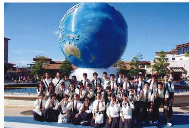
修学旅行(後期) 日本のすばらしさを 再発見できる国内旅行