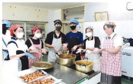
ボランティア活動 うわつ子ども食堂に参加