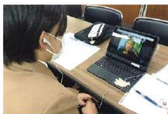
アデレード短期語学研修