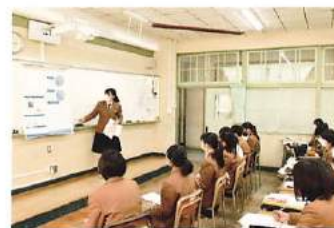
課題研究校内ポスター発表会