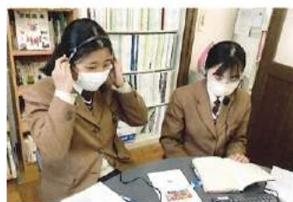
全国高校生Pre SDGs Youth Summit