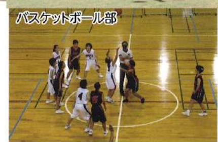
バスケットボール部