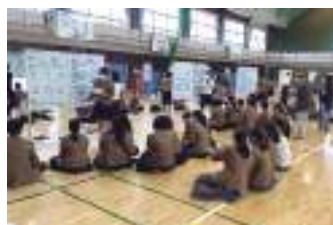
課題研究成果校内ポスター発表会