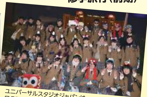
ユニバーサルスタジオジャパンはワクワク感じっぱいです。