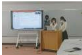
全国高校生SDG's Youth Summit