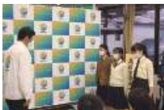
高校生まちづくり課プロジェクト