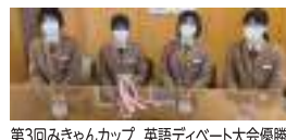
第3回みきゃんカップ 英語ディベート大会優勝