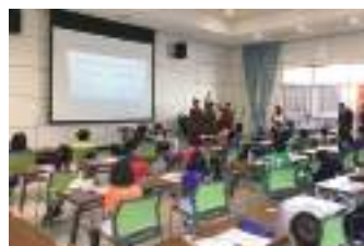
宇和島圏域子ども観光大使講師