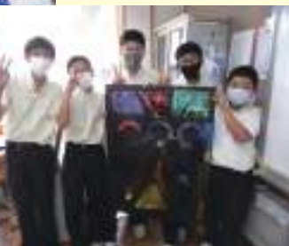
造形大会 芸術を感じる秋の1日