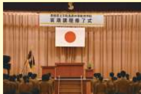
前期課程修了式 いよいよ後期課程