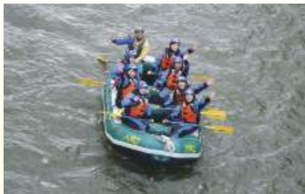
修学旅行(後期) 日本のすばらしさを再発見できる国内旅行