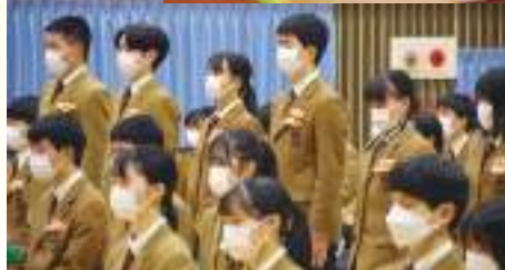
6年間の思いを胸に新しいステージに向かいます。