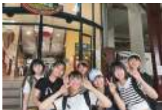
オーストラリア語学研修

フィールドワーク(現地調査)や課題研究を通して、広い視野から世界や宇和島を見つめ、地域社会で活躍するリーダーの育成を目指します。また、海外の学校や国際機関との交流プログラムを提供し、生徒の英語によるコミュニケーション能力を向上させ、発表したり伝えたりする力、また議論する力を養います。