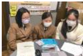
全国高校生フォーラム2022