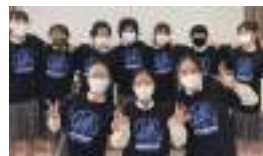
アメリカ合衆国ノースキャロライナ州での日本文化の祭典Animazement(オンライン)