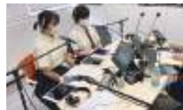
防災ラジオ番組出演