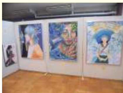
いろいろな発表や展示 会場は笑顔が絶えません